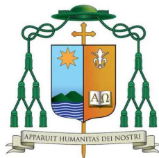
Diocesi di Acerra