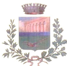
Comune di Casalnuovo di Napoli