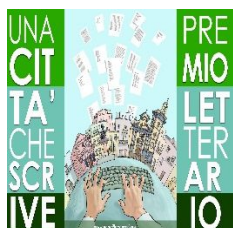
Associazione Socio-Culturale Una città che scrive