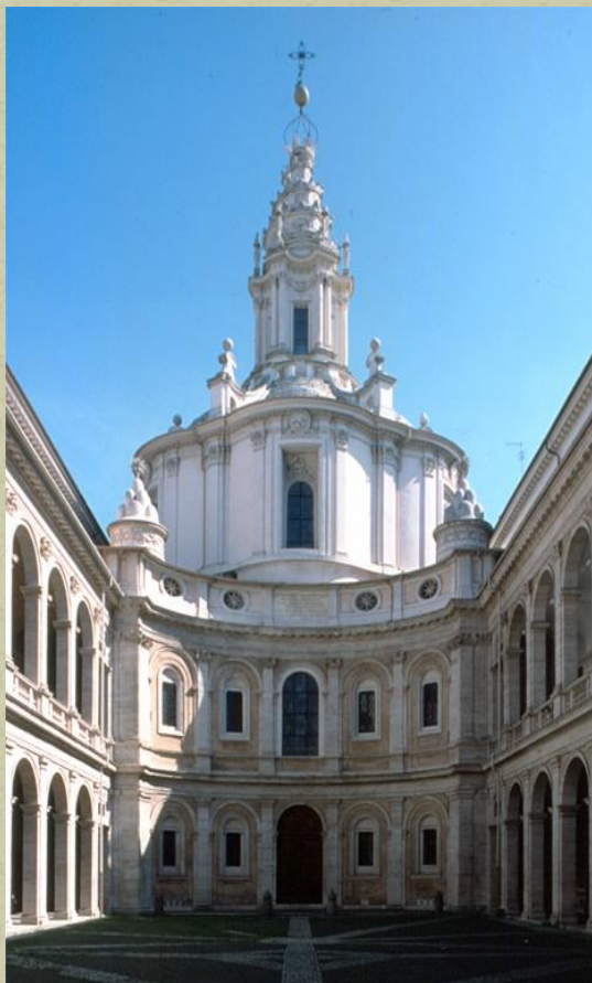
Borromini_ Sant'Ivo alla Sapienza Roma

Architettura, Pittura e Scultura si amalgamano in un'unica forma espressiva, un tripudio di colori, di forme che si completano a vicenda. Dinamismo e una visione infinita dello spazio.