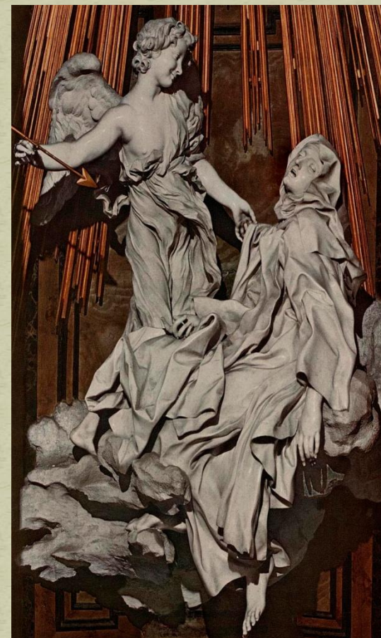
Bernini _ Estasi di Santa Teresa Roma