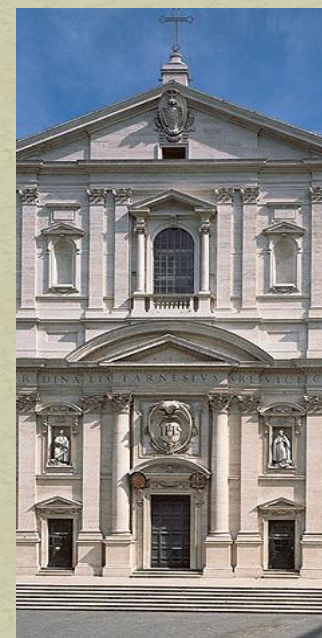
Giacomo Della Porta

https://it.wikipedia.org/wiki/Palazzo_Te