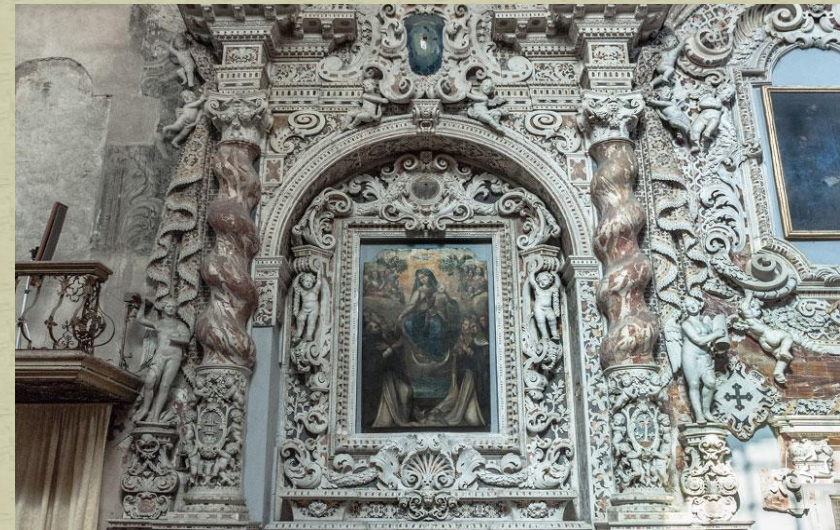
Altare_ Chiesa Valverde Palermo