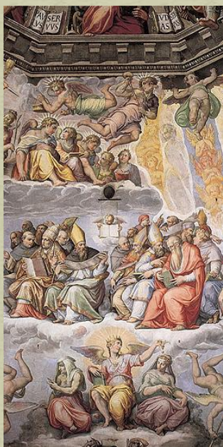
Giorgio Vasari Cupola di S. Maria del Fiore _ Firenze

Le prime anticipazioni alla fine del XVI secolo con la crisi spirituale e culturale del Rinascimento che porta alla nascita del Manierismo