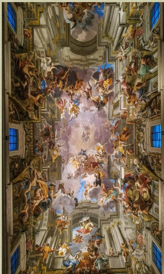
Andrea Pozzo_ Gloria di Sant'Ignazio Roma