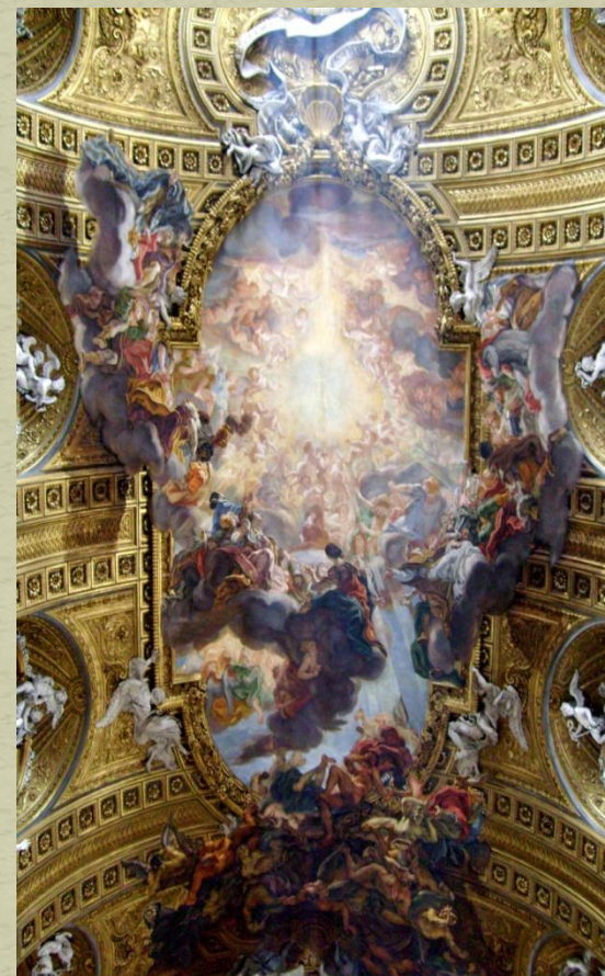
G. B. Gaulli – Chiesa del Gesù Roma