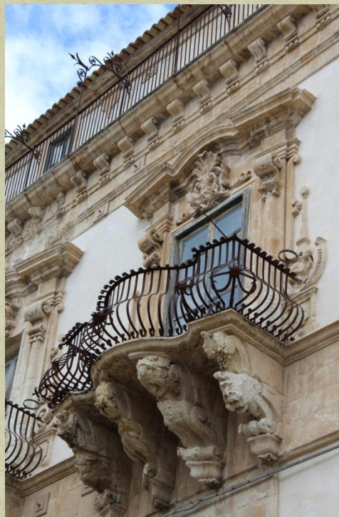
Particolare palazzo a Scicli

La pittura imita sia la scultura che l'architettura con degli effetti scenografici illusionistici talmente realistici da confondere lo spazio reale con quello non reale cioè dipinto.