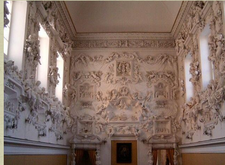
Serpotta Oratorio di Santa Cita