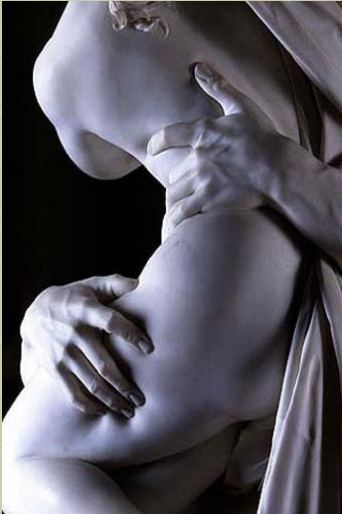
Bernini Particolare: Ratto di Proserpina

La scultura barocca ricerca gli effetti stilistici e formali tipici della pittura. Deve sorprendere per il suo realismo e virtuosismo