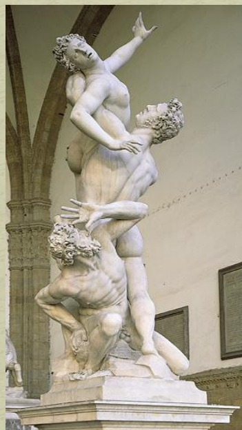
Giambologna _Ratto delle Sabine

https://www.formacultura.it/2018/09/17/la-grande-cupola-di-santa-maria-del-fiore/