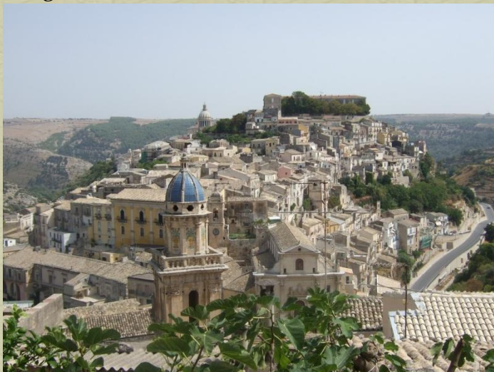
Vista panoramica Ragusa Ibla

L'integrazione tra le tre arti è un dolcissimo connubio tale che anche le città che le ospitano sono anch'esse scenografiche e la natura tanto decantata e rappresentata, diventa parte dell'allestimento teatrale ... tutto, insomma, diventa un enorme palcoscenico.