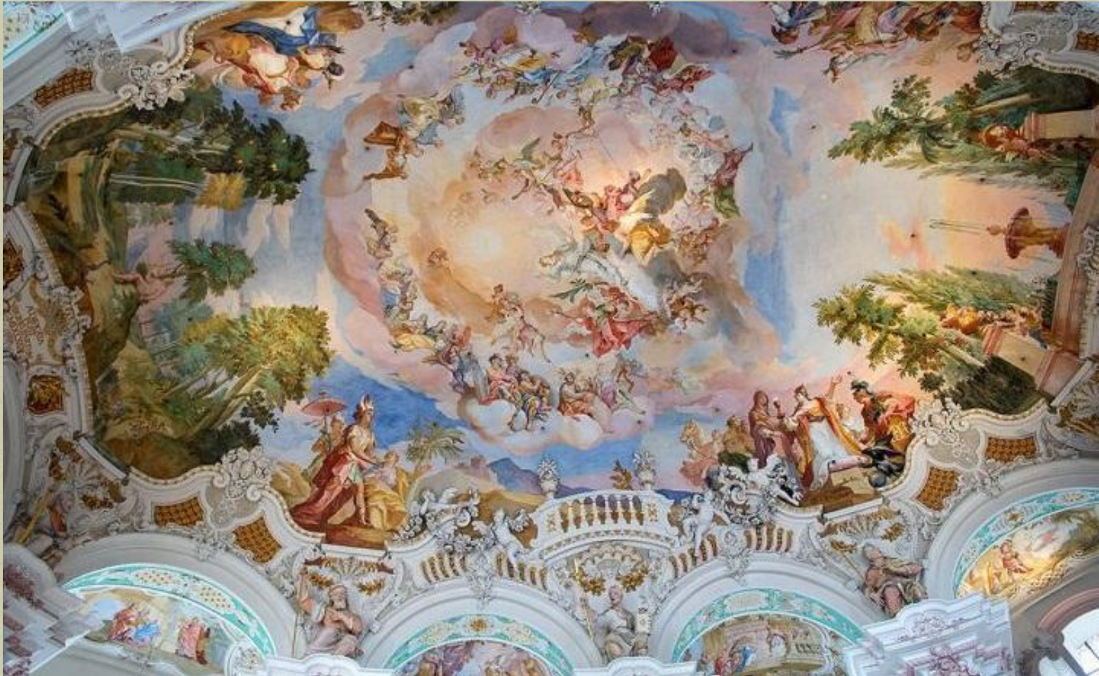
Affresco _Chiesa Steinhausen Germania

Scopo: sbalordire l'osservatore attraverso la spettacolarizzazione spaziale.