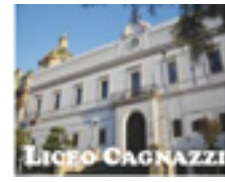
Liceo classico Luca de Samuele Cagnazzi