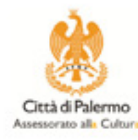
Comune di Palermo