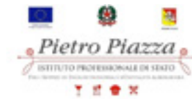
IPSSEOA Pietro Piazza